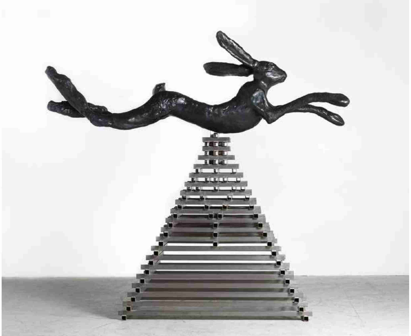
Barry Flanagan, «Large Leaping Hare», 1982. Le sculpteur britannique fait l'objet d'une exposition dans un espace à part. (Photo: David Clarke/ProLitteris)