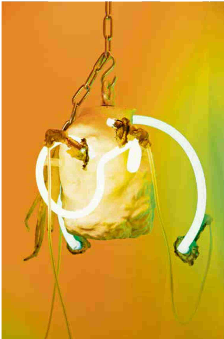
Détail de «Tafaa-Acid Rave», 2019, de Chloé Delarue. Elle est une des nominés du Prix Mobilère, décerné à Artgenève. (Chloé Delarue, Mobilère)