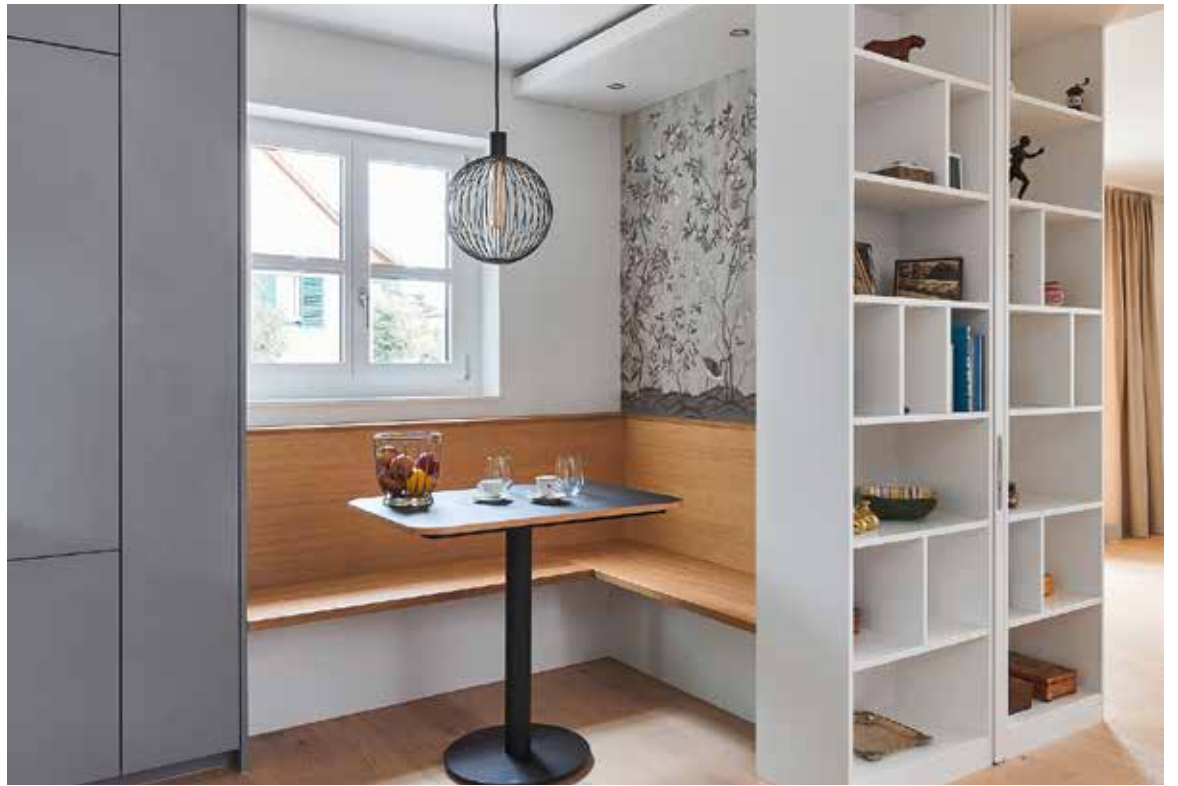
Eckbank im modernen Kleid: Ein Platzspar-Klassiker für die Küche, der sich hier frisch und offen zeigt. Zusätzliche Regale und Einbauschränke schaffen Stauraum.

Auf unnötige Details sollte jedenfalls verzichtet werden. Für eine grosszügige Wirkung sollte ein Raum keinesfalls überfrachtet, sondern durch gezielt gesetzte Akzente belebt und auch mit Freiflächen unterstützt werden. Insgesamt wirken alle Räume beengt, wenn die Einrichtung optisch zu gross ausfällt oder ungünstig angeordnet ist. Wo Wohnfläche Luxus ist, zählt sich die Investition in einen kreativen Innenausbau in mehrfacher Hinsicht aus.