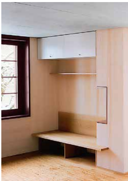
Eine Sitzbank mit vielen offenen und versteckten Stauraummöglichkeiten: Auf engem Raum kann mit einer cleveren Schreinerarbeit wie hier von Vogel Design ein Maximum an Nutzen erzielt werden.