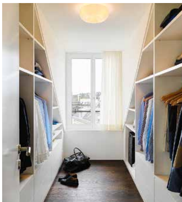
Jeder Zentimeter wird genutzt in diesem schmalen Ankleidezimmer unter der Dachschräge. Präziser Schreinerarbeit sei Dank.