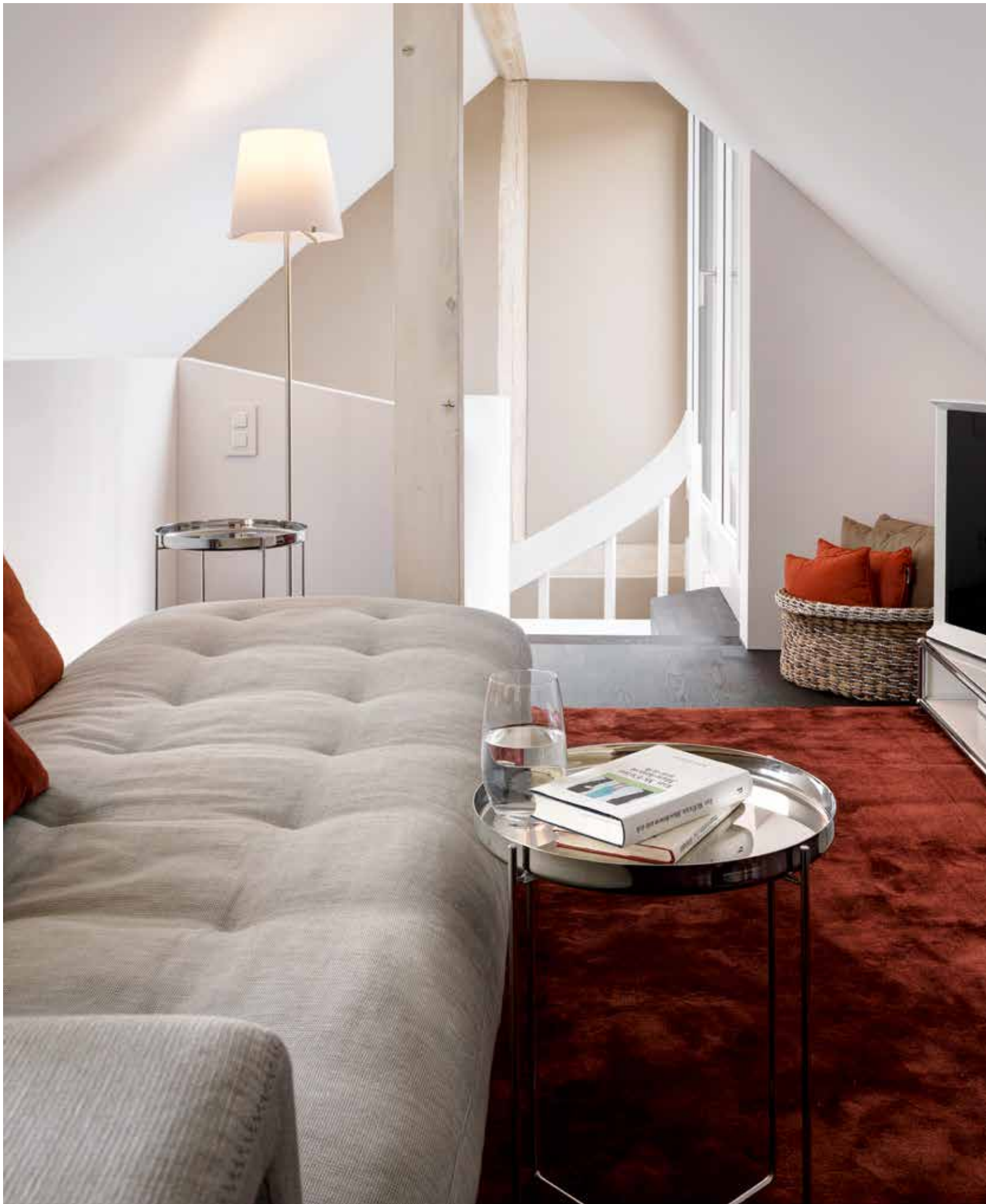
Platzschaffende oder -sparende Massnahmen lassen sich sowohl beim Bau als auch bei einem späteren Innenausbau oder -umbau einbringen – wie beispielsweise bei der Nutzung des Dachstockes als Wohn- wie auch als Stauraum.