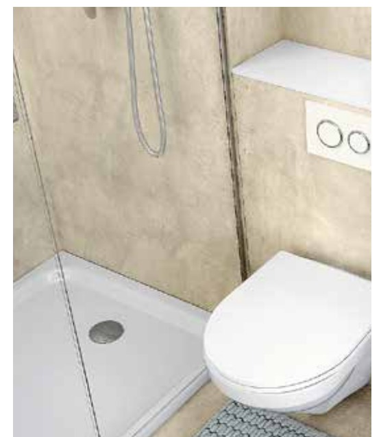
Mit platzsparenden Vorwandmöbeln, Unterputzinstallationen und individuellen Einbaulösungen mit verborgenem Stauraum von Talsee sind auch kleinste Bäder gross genug.