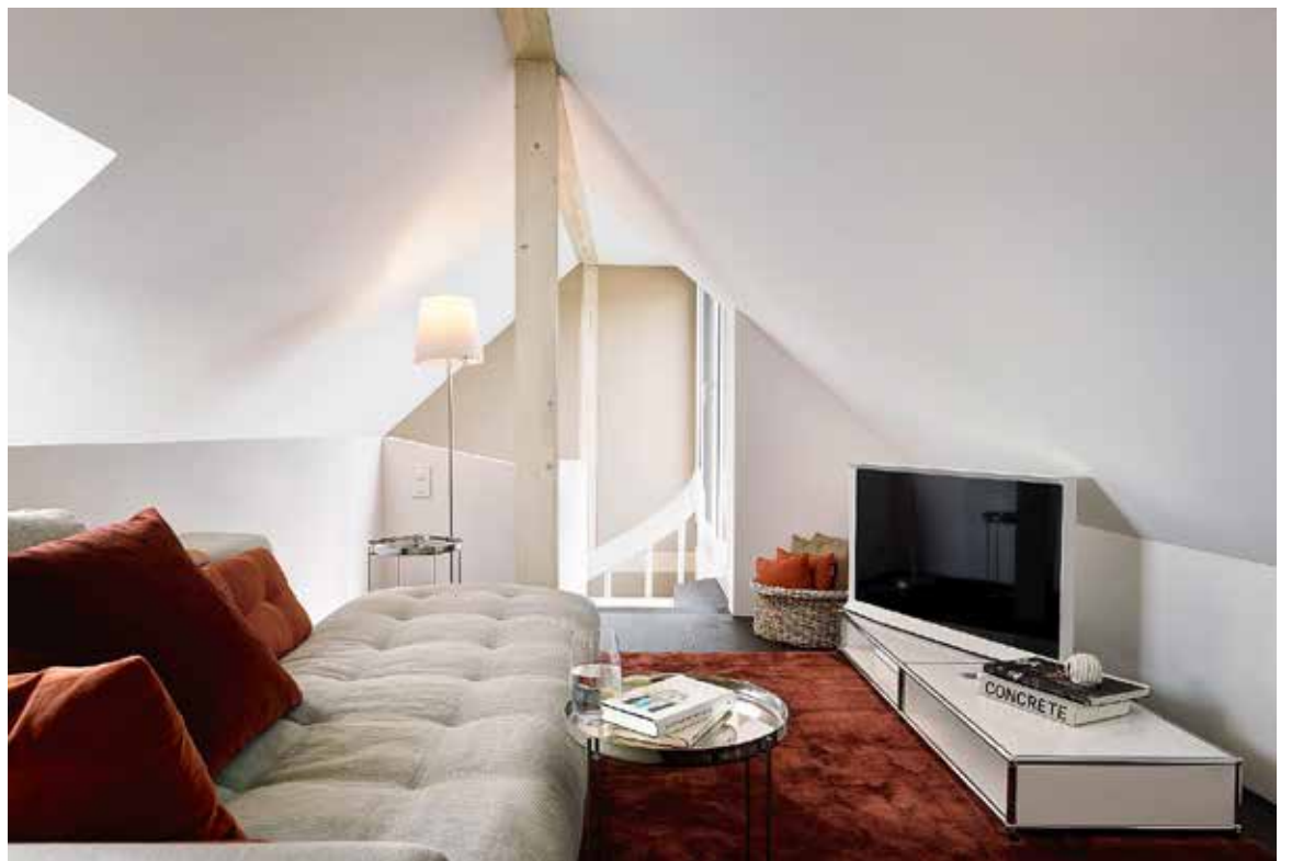
Eine zusätzliche Empore in einer Giebelwohnung eignet sich ideal als Rückzugsort, clever geplant und eingerichtet durch die Innenarchitekten der Teo Jakob AG. Mit flachen Möbeln zum Sitzen und Liegen wird der Raum optimal genutzt. BILD TEO JAKOB AG / PIERRE KELLENBERGER