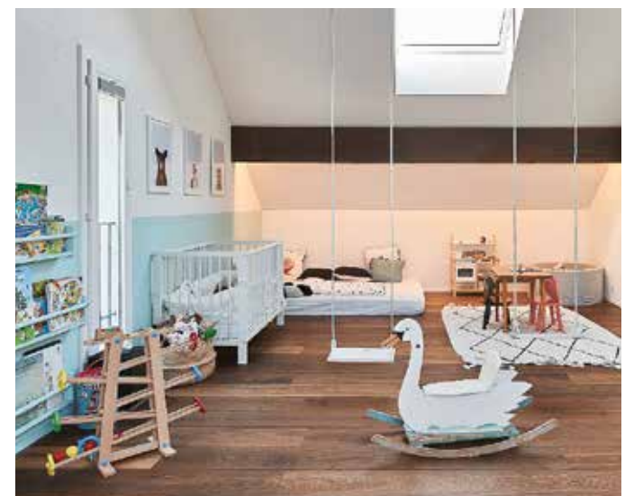
Aus einem engen, dunklen Dachstock hat das Innenarchitekturbüro Raumtakt GmbH ein helles Spielparadies für Kinder geschaffen: Ein zusätzliches Dachfenster für mehr Licht, beidseits zugängliche Einbauschränke für Ordnung sowie eine Kuschecke unter der Schräge.